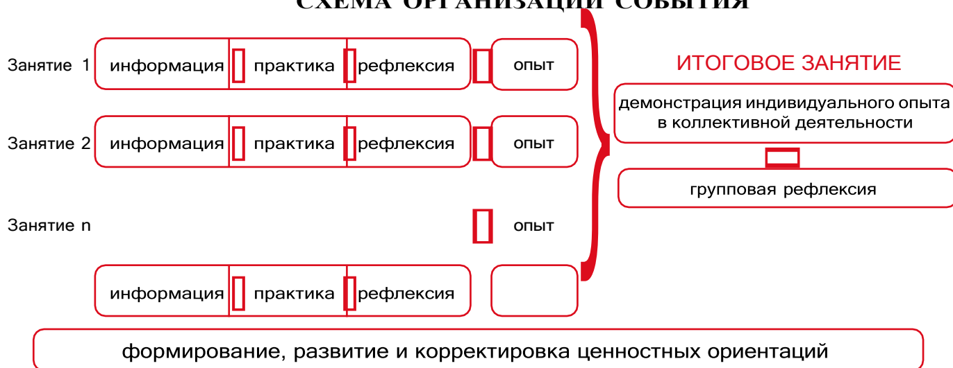
Рисунок 1 — Схема организации события

Таким образом, у пятиклассников происходит построение логической цепочки от собственного опыта проживания каждого занятия к ознакомлению с опытом других детей и к формированию общего отношения классного коллектива к прожитому ими событию.